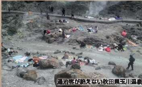
湯治客が絶えない秋田県玉川温泉

北投石は世界でも、秋田県玉川温泉と台湾の北投温泉の二か所からしか産出されません。天然記念物の為、採取できず希少な石です。玉川温泉は国内屈指の湯治場。昭和年代にテレビで幾度も報道され反響を呼び最近では2018年6月にNHKドキュメンタリー-72「秋田」いのちの温泉」に集う人々が放映されました。